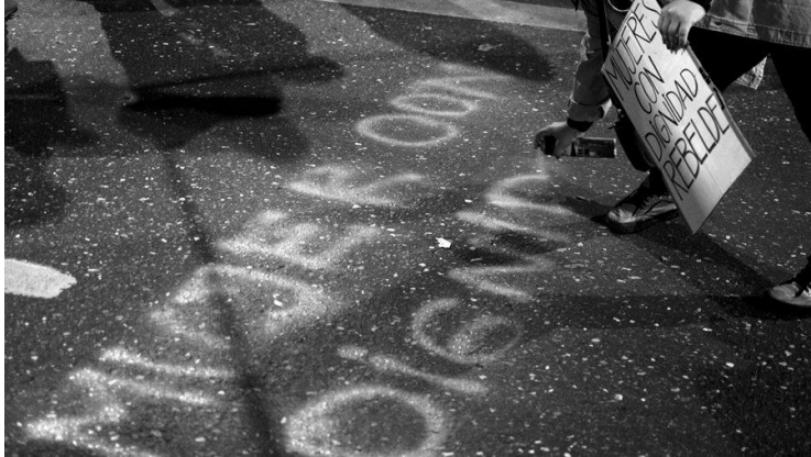
(Imagen: Colectivo Manifiesto)

recomienda dar esos detalles por el conocido “efecto imitación” que puede inspirar a otros y porque todos insinúan la impunidad de algunos a la hora de cometer un femicidio.