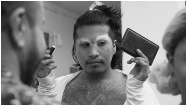
(Imagen: Colectivo Manifiesto)

Los lentes de género (metáfora que se utiliza cuando se ve a las personas como sujetos que pertenecen a una sociedad con marcas de género) nos llenan de preguntas: ¿nacen los varones biológicamente predispuestos a usar el azul, jugar con autitos, amar el fútbol, ser los proveedores económicos del hogar, no mostrar demasiado sus emociones, gustar de las mujeres? ¿Nacen las mujeres biológicamente predispuestas a usar el rosa, perforar sus orejas con aretes ni bien nacen, jugar con muñecas y cocinitas, ser emocionales, amas de casa y desear a los hombres? No hay ninguna célula u hormona que vincule características fisiológicas con roles sociales. Esa vinculación social y cultural es lo que la categoría género quiere resaltar.