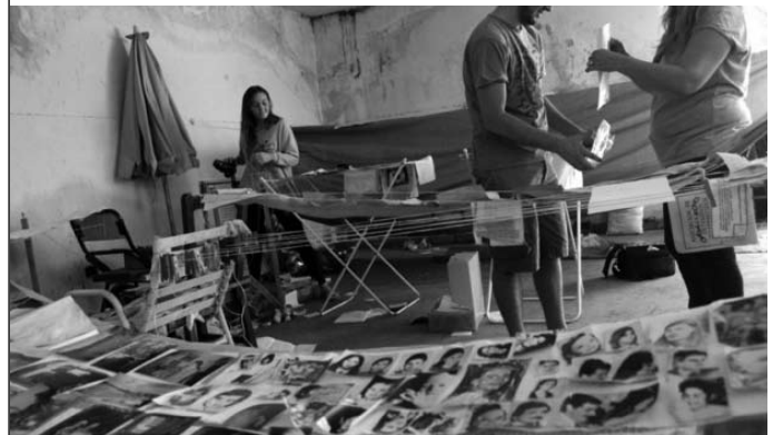
1-Chicha Mariani fue distinguida con el título de Doctora Honoris Causa de la UNLP, por su lucha por los DDHH.

Si bien los efectos del desastre pudieron atemperarse gracias a la inmediata colaboración de instituciones y voluntarios, la actual situación requiere de la intervención de extensionistas especialistas para la fase final de la recuperación documental y -fundamentalmente- la restauración y adecuación física del ámbito a fin de garantizar la seguridad del material documental y bibliográfico y la habitabilidad de la sede.