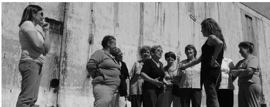
◀ Frente al murallón del ex frigorífico “Swift”

El final de curso, fiesta y alegría. Los alumnos realizaron seis afiches temáticos, donde expusieron gran parte de lo tratado en las clases. Les entregamos una postal recordatoria de nuestro viaje, y compartimos una presentación audiovisual sobre lo hecho grupalmente. Quién nos quita lo contado...¡Quién nos quita lo vivido!