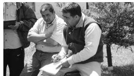
◀ La vinculación social con el medio