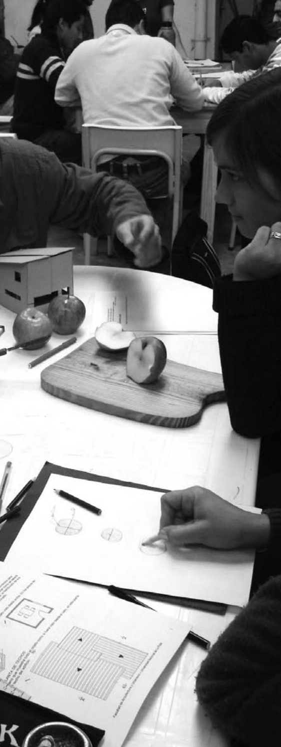
Trabajos en aula y obra