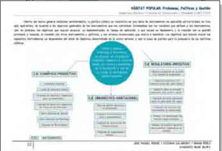
Propuesta y diseño de lineamientos de políticas públicas, estrategias de intervención y desarrollo de instrumentos de gestión sobre las problemáticas del hábitat popular (medios-fines-objetivos) para la ciudad de La Plata en general, incluyendo las necesidades de los barrios El Molino y El Gigante del Oeste en particular.