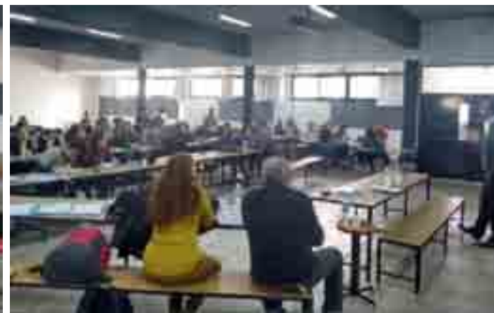
Mesa con referentes municipales, provinciales y nacionales