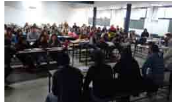
Mesa con vecinos y referentes de los barrios