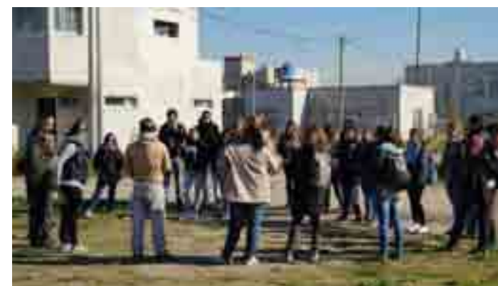
Visita, recorrida, charla e intercambio con vecinos del barrio ProCreAr - Gigante del Oeste, localidad de Olmos.

Desde otro ángulo, esta propuesta fortalece la relación con el resto de las materias del plan de estudios al rescatar contenidos específicos de teoría, planificación, arquitectura y construcciones, en la realidad particular de los problemas del hábitat, estimulando la mirada compleja desde lo espacial, lo social, lo normativo, lo económico, etc. De esta manera, esta asignatura “Hábitat Popular: Problemas, Políticas y Gestión”, se sustenta en una doble articulación: una atada a los contenidos específicos de las materias obligatorias del plan de estudios, y otra, tendiendo puentes con la realidad de nuestras ciudades y las políticas públicas sobre problemáticas específicas.