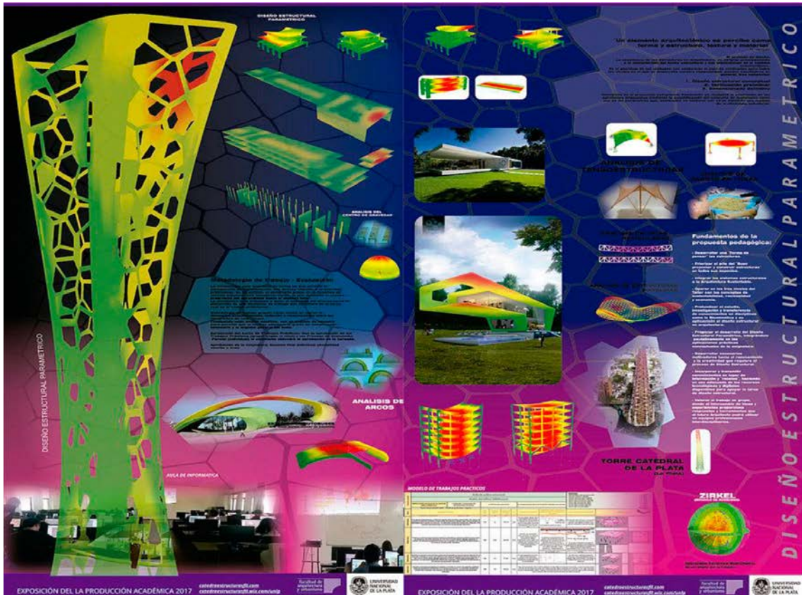
Modelos paramétricos para estudio realizados por la Cátedra de Estructuras FLL – FAU - UNLP