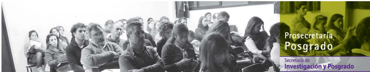
Programa de Capacitación Docente – PCD