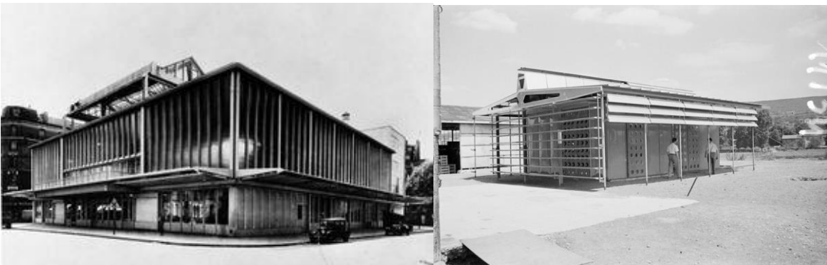
La Casa del Pueblo de Clichy, El Pabellón de Aluminio (Casa tropical), Jean Prouvé, Francia

En contrapartida a ello, entendiendo al proceso de concebir la forma de diseñar contemplando los recursos disponibles, entendiendo con profundidad las tecnologías al alcance y cual serían las técnicas que harían posible materializar los mismos, podemos resumir dichos aspectos en la obra de Jean Prouvé (1901-1984), figura clave de la arquitectura y el diseño del siglo XX. Desde sus comienzos en la forja de elementos para edificios y en la producción de muebles metálicos, y hasta su última etapa de desarrollo del muro cortina y de las estructuras en celosía, el artesano y fabricante francés dedico su fértil talento creativo a la reconciliación del arte y la industria. En asociación con arquitectos e ingenieros realizó grandes obras como el Club de Aviadores Roland Garros, el Pabellón de Aluminio, la Casa del Pueblo de Clichy o la nave de bebidas Évian, en los cuáles se ve como la imaginación técnica se pone al servicio de la forma y la función. Estableció de esta manera una continuidad sin suturas entre los procesos de diseño proyectual, los de fabricación y la puesta en obra de los mismos, llevando al máximo el potencial de los recursos disponibles de su época.